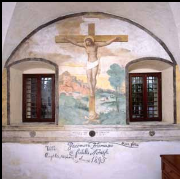
ANNONE VENETO, chiesa di San Vitale, pittore veneto, affresco, Crocifissione.

Several artistic treasures of the area, related to the period 1450-1550, are shown in the exhibition, others are visible in their original locations which are spread along the routes shown here: these routes can become not only an artistic occasion to complete the exhibition but also an opportunity to taste the eno-gastronomic excellences of our territory.