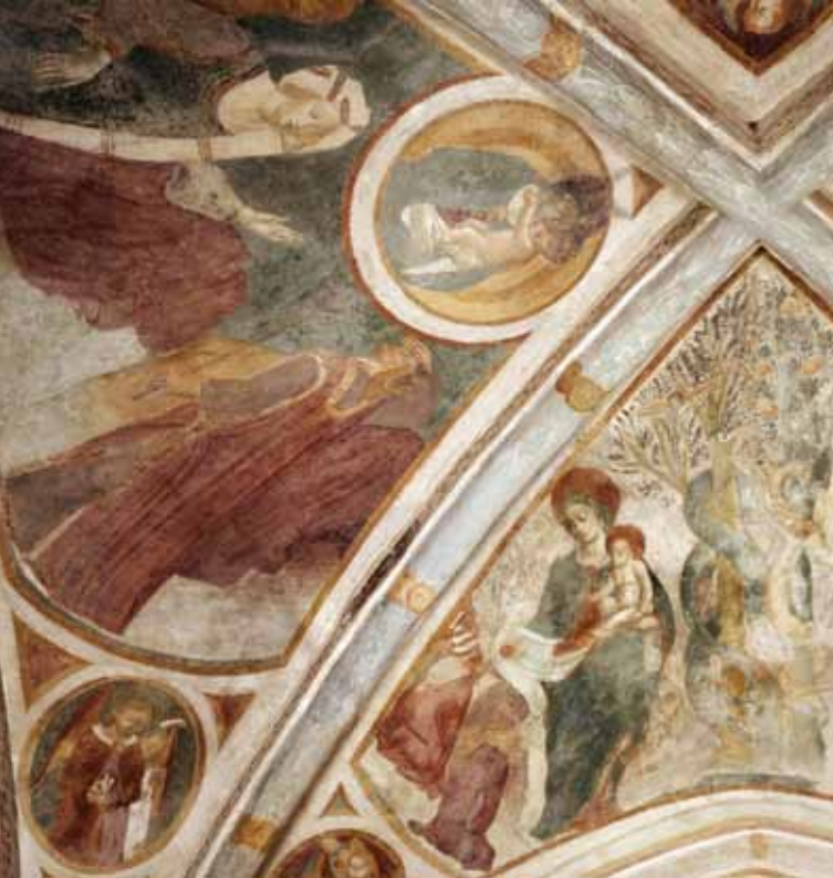
LIGNANO PINETA, chiesa di Santa Maria di Bevazzana, Maestro di Bevazzana, ciclo di affreschi (part.).

“Chi parte da Venezia, dopo un viaggio di due ore [...] giunge al limite del Veneto e, per dissolvenza, entra nel Friuli. Il paesaggio non sembra mutare, ma se il viaggiatore è sottile, qualcosa annusa nell’aria. È cessata sulla Livenza la campagna dipinta da Palma il Vecchio e da Cima...”